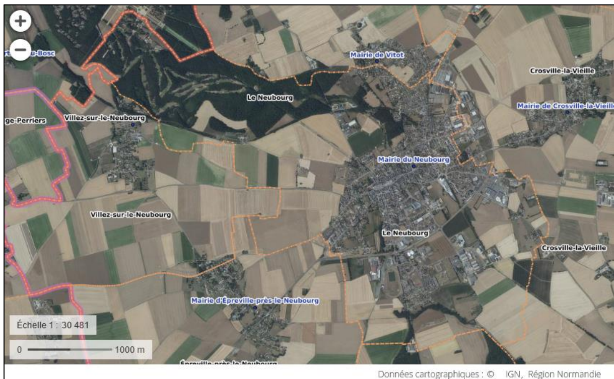
Figure 1 : Carte de la Ville du Neubourg