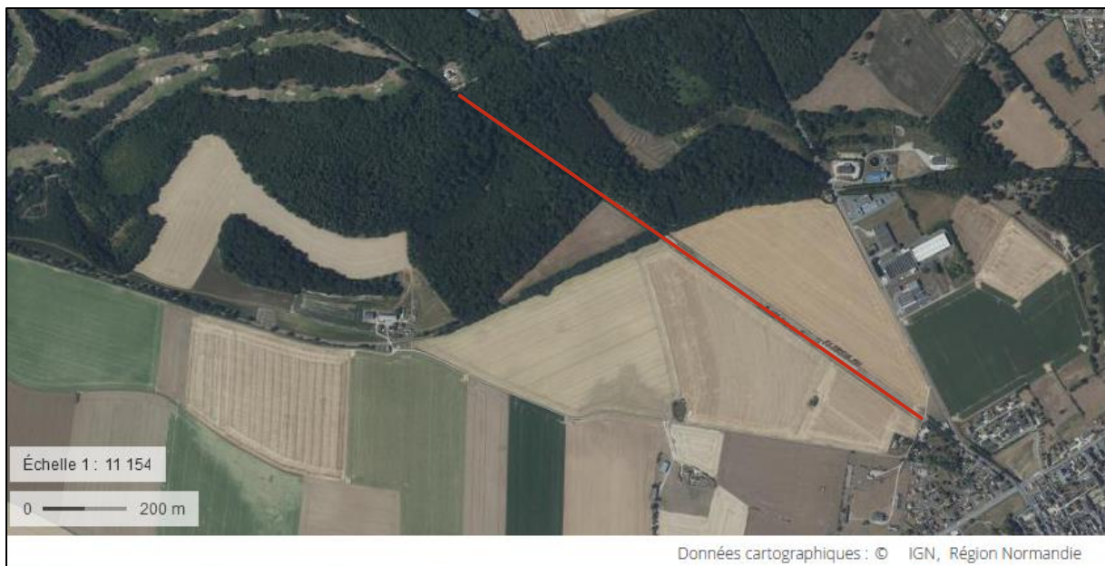
Figure 2 : Carte de notre transect d'étude