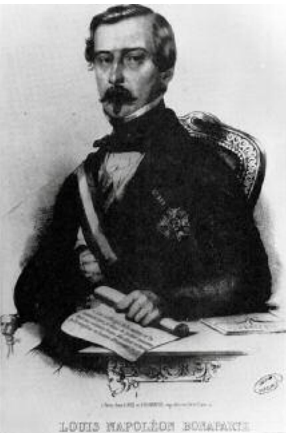
LOUIS NAPOLEON BONAPARTE

Après la lecture le bureau a signé. Approuvé par les membres du bureau.